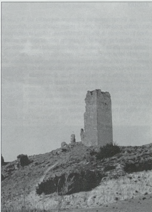
Torre del Cuadrón

Arranque de bóveda de crucería del primer piso