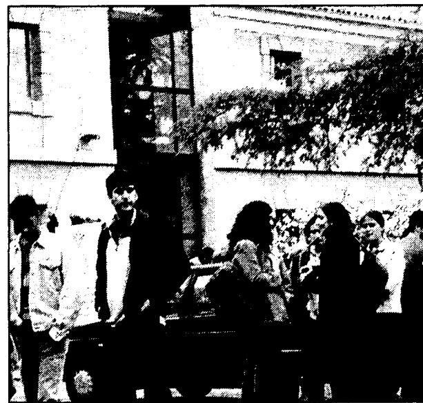
Azuqueca es una de las poblaciones más jóvenes de la región.

do talleres y cursos de todo tipo a lo largo de todo el año con el fin de cubrir la totalidad de las demandas juveniles, desde ecología, naturaleza, astronomía, cursos de percusión o escuela de aprendizaje de esquí, entre otros. Con un presupuesto de unos 5 millones de pesetas para el año 2000.