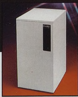
Grupo termodoméstico de alto rendimiento