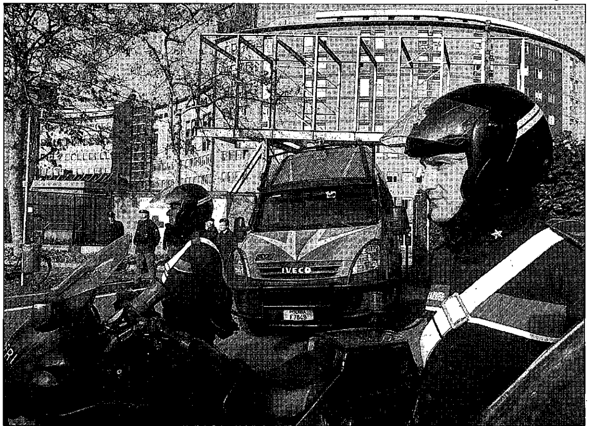
Varios agentes custodian el hospital San Raffaele de Milán, donde se encuentra ingresado Berlusconi.

tos del Estado para 2010, que contemplan un nuevo endeudamiento de casi 86.000 millones de euros, más del doble que durante el presente año. Con ello, el Gobierno aprueba el mayor endeudamiento, con diferencia, en la historia de Alemania desde la II Guerra Mundial.