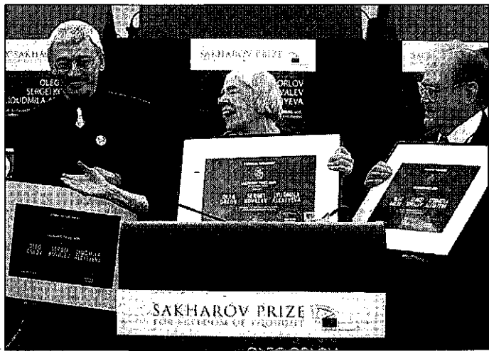
Los activistas Orlov, Alexeyeva y Kovalev, con el galardón.

En este sentido, Memorial animó a la UE a no dudar en presionar a las autoridades rusas para que se encarguen de mejorar la situación de los derechos en el país. «Eliminar asuntos sensibles de las agendas daña a Moscú, pero también a Europa», advirtió Kovalev.