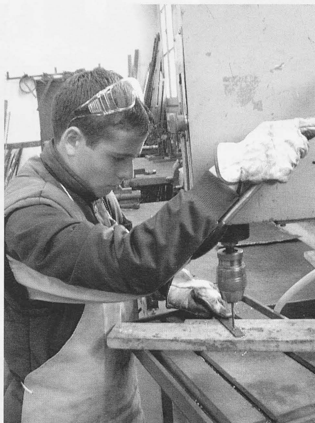
Los alumnos de la Escuela Taller aprenden un oficio.

el Vivero de Empresas y en el Don Diego, y percibirán una beca del Sepecam consistente en 6 euros diarios para ayuda de la formación. En la segunda, tercera y cuarta fase serán contratados por la entidad promotora (Ayuntamiento) y ejecutarán la rehabilitación de los edificios que tienen asignados, cobrando un sueldo que supondrá el 75% del salario mínimo interprofesional. De los 40 alumnos, 16 pertenecen al taller de albañilería y habrá tres grupos de 8 alumnos más para los talleres de carpintería metálica y forja, carpintería de madera y pintura, dirigidos por 5 monitores. El equipo directivo lo for-