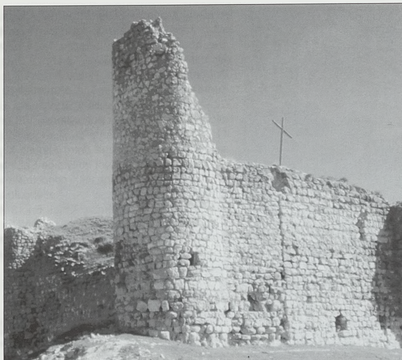
Castillo de Cogolludo, detalle