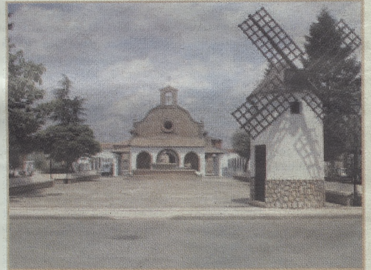
En la fotografía superior, vista de la Iglesia Parroquial de San Miguel Arcángel. Junto a estas líneas, una imagen del edificio del Ayuntamiento, situado en la Plaza Mayor. Arriba, la plaza de Ruiz Jarabo, donde se halla la ermita de Santa Rita.

municipal. Uno de los edificios más emblemáticos de Mota es la Casa de la Tercia , en la plaza de igual nombre. Se trata de un inmueble del siglo XV que sirvió de almacén de trigo y que está declarado Bien de Interés Cultural. En cuanto a los edificios religiosos destacan la Iglesia Parroquial San