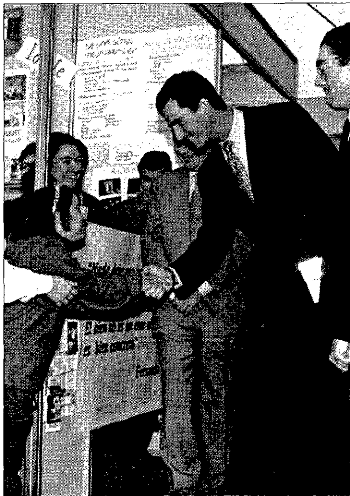
SOLIDARIDAD REAL Don Felipe saludó a una niña tras inaugurar ayer la feria.

Los que prefieren solidarizarse con el 'bolsillo' pueden elegir entre hacer donativos económicos, apadrinar niños del Tercer Mundo, comprar re-