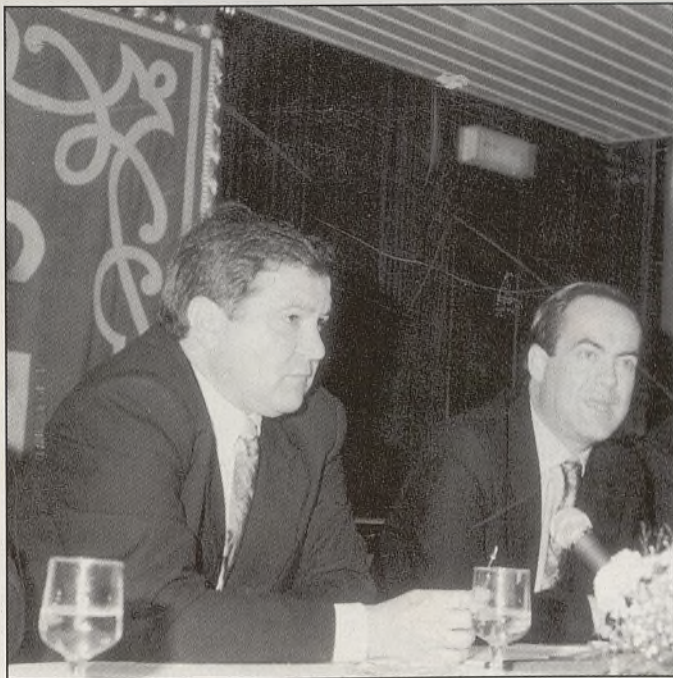
Bono acudió en ayuda de Corrochano, prometiendo inversiones en Talavera por valor de 7.000 millones de pesetas.

También Cazalegas, Gamonal y Talaverilla hicieron oír su voz. Los vecinos de Cazalegas , pequeña localidad situada a seis kilómetros de Talavera , se enfrentaron al Ayuntamiento ante la posibilidad de la instalación de una planta incineradora de residuos tóxicos en su término municipal. BISAGRA realizó un sondeo —ante la posibilidad de la convocatoria de un referéndum por parte del Ayuntamiento para decidir sobre el asunto—. La respuesta de los vecinos fue muy clara: el 54 por 100 dijo «no» a la incineradora. Gamonal y Talaverilla se ma-