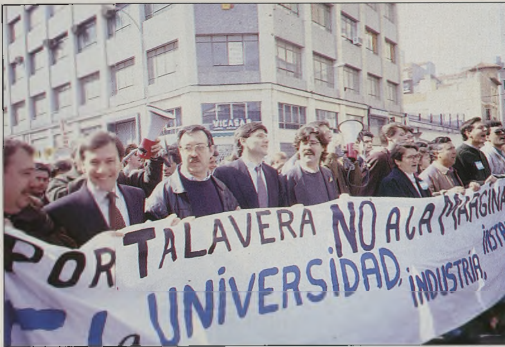
1992 fue el año en que la coordinadora Nosotros Talavera alcanzó un gran protagonismo social.