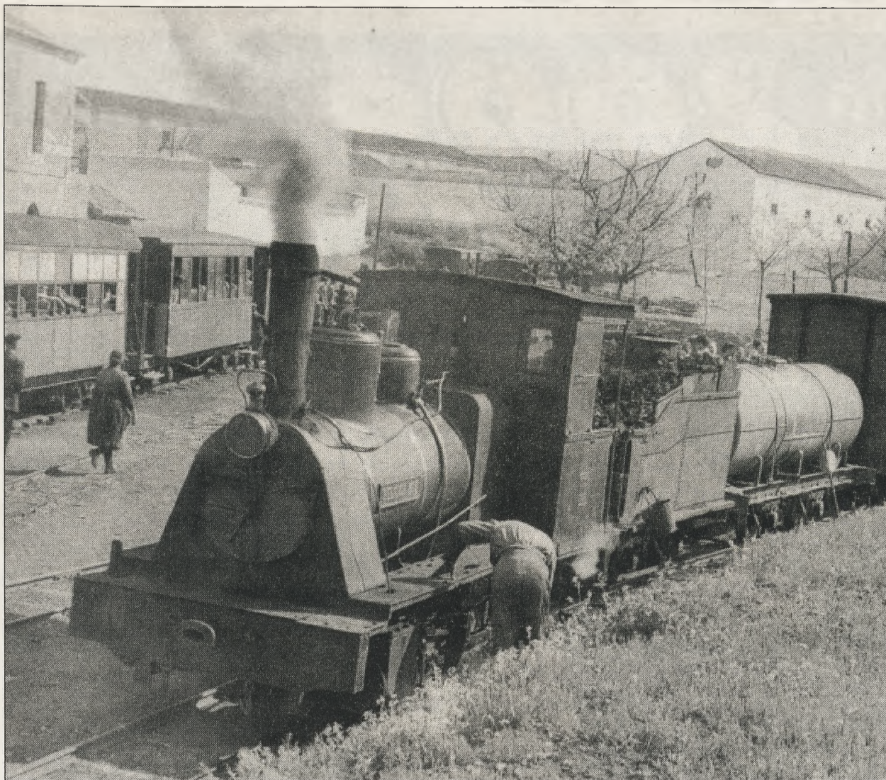
Locomotora nº 3 Belgica, en espera de tomar servicio en Calzada (1962). D. Trevor Rowe. Vía Estrecha en España. MAF

En Valdepeñas, se enajenaron todos los inmuebles para una empresa. Los Ayuntamientos del Moral de Calatrava y Calzada de Calatrava adquirieron toda la traza de la vía, siendo posteriormente vendidos a los propietarios de fincas colindantes. En el termino municipal de Granátula de Calatrava la venta