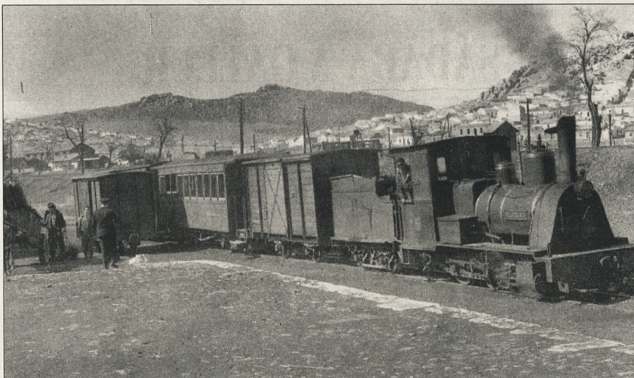
Locomotora nº 3 Belgica, antes de su salida en Puertollano (1962). Javier Aranguren Vía Estrecha en España. MAF

de terrenos a particulares ha ascendido a 18.877 metros cuadrados. De igual forma que en el de Argamasilla de Calatrava en la que FEVE ha vendido unos 19.500 m2 a varias fincas particulares. Por último el Ayuntamiento de Puertollano adquirió todos los terrenos de su termino municipal.