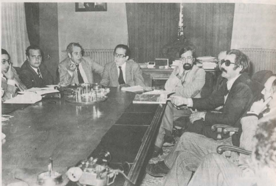
EMPEÑADOS EN HACER PARTICIPAR A LOS CIUDADANOS

Una de las ideas más interesantes contenidas en el proyecto aprobado al equipo "Cuenca 76" es la de pedir la participación de los ciudadanos en la