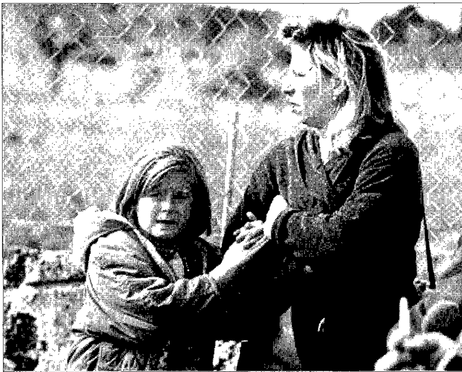
CONMOCIÓN Los vecinos recibieron la noticia impresionados y muchos no pudieron contener el llanto.

Aunque de momento no se ha detenido a ninguna persona ni se ha encontrado el arma homicida —posiblemente del calibre 635—, el hecho de que los cadáveres tuvieran dos impactos en la cabeza —“el segundo se hace siempre para rematar”— y que, posiblemente, fueron hechos a través de una almohada para amortiguar el ruido hace pensar a los investiga-