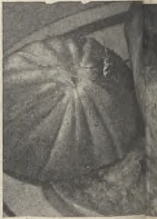
Este par de moscas paradas sobre un plato de comida taminarán con las más diversa flora bacteriana que en ellos verdaderas miríadas de millones.