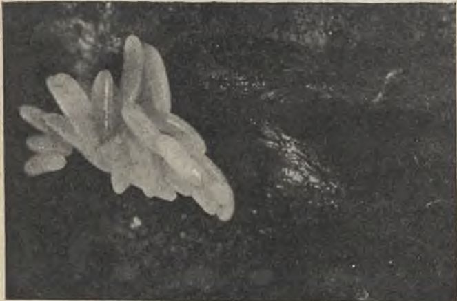
En un trozo de carne mal guardada, el objetivo microfotográfico ha encontrado este depósito de huevos de mosca, que rápidamente se transformarán en larvas.