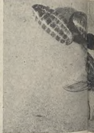
Apenas salidas de la «teca» o estuche en que se encuentran casi su aspecto definitivo.