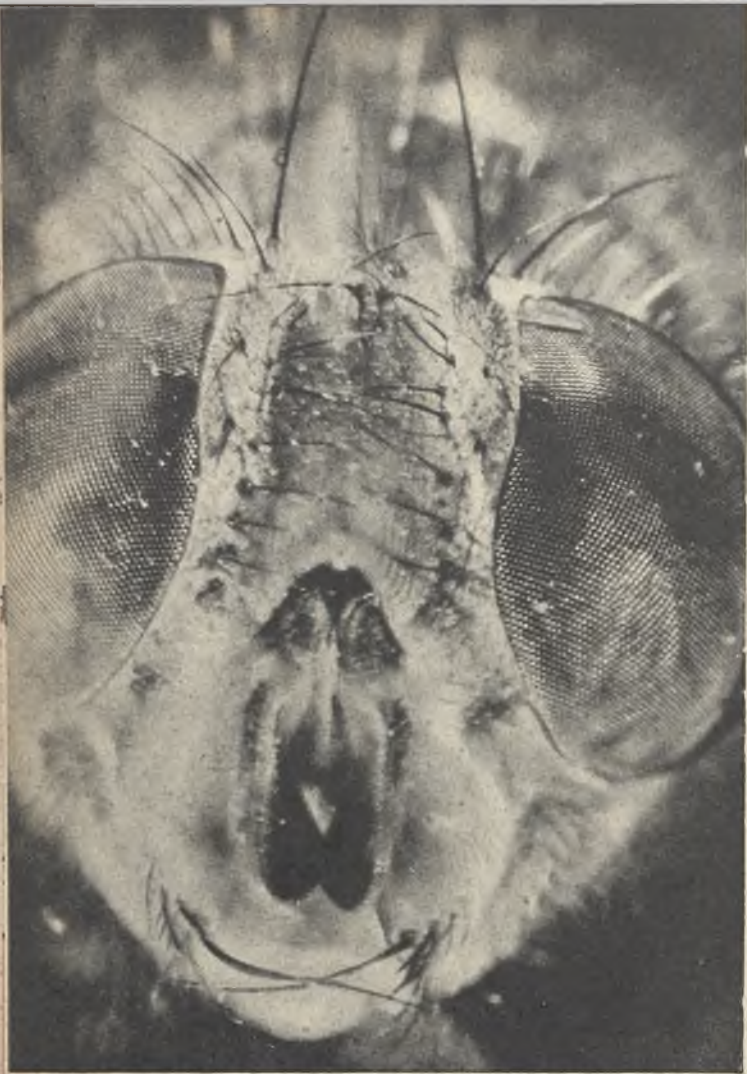
He aquí el fantástico aspecto que ofrece, vista de frente, al microscopio, la cabeza de una mosca: dotada de enormes ojos, con la córnea en facetas, como los faros de los automóviles, que les permite una portentosa facultad visual.