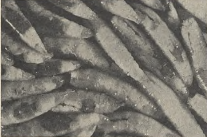
Este es el brillante aspecto que ofrecen las larvas de moscas poco antes de dar nacimiento al nuevo ser.