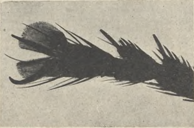
Este es el aspecto que presenta, vista con gran aumento, una pata de mosca. En sus pelos y en sus talones almohadillados llevan siempre los microbios tomados de los basureros en que buscan su alimento, trasportándolos hasta depositarlos sobre nuestra piel, nuestras mucosas o nuestros alimentos.