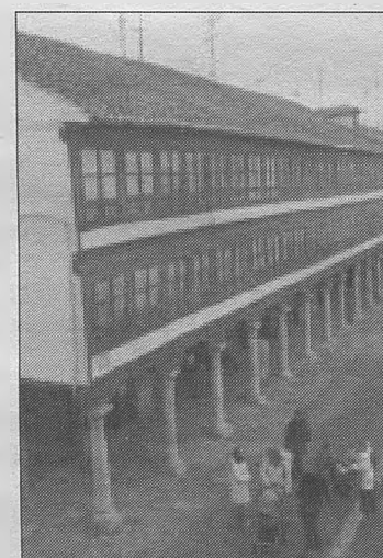
PLAZA MAYOR Y ALEDAÑOS