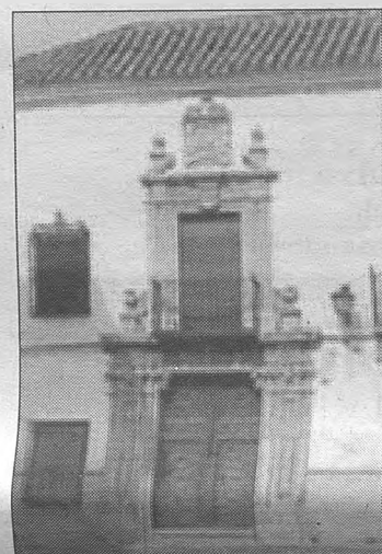
PLAZA DE SANTO DOMINGO