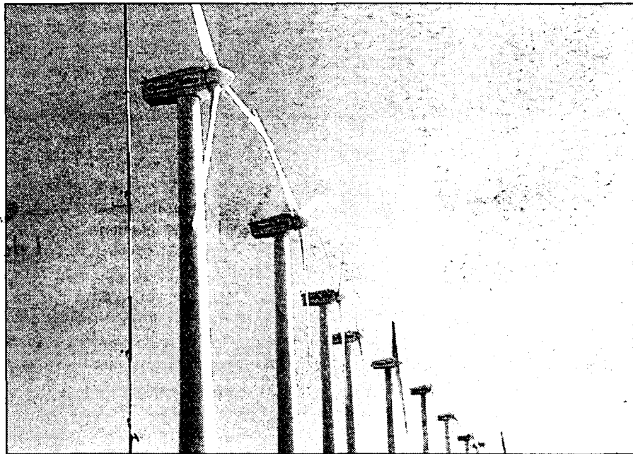
La provincia de Guadalajara cuenta ya con varios parques eólicos, como en Hijes o Molina de Aragón.

Iberdrola Diversificación invertirá en esta construcción en torno a 1.500 millones de pesetas