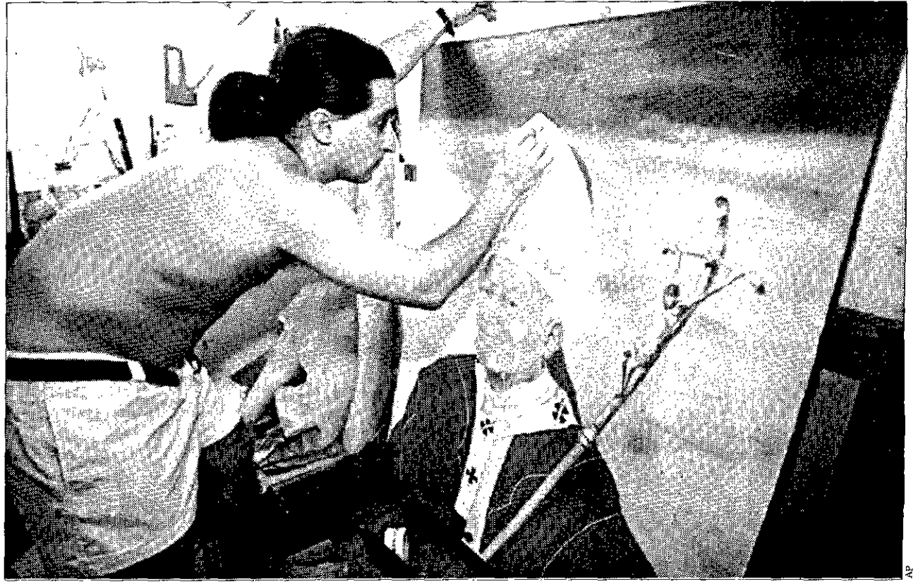
PINTAR AL PAPA Un pintor da los últimos retoques a un retrato de Juan Pablo II, en su taller de La Habana.

Por otra parte, el vicepresidente de la Conferencia Episcopal italiana y ar-