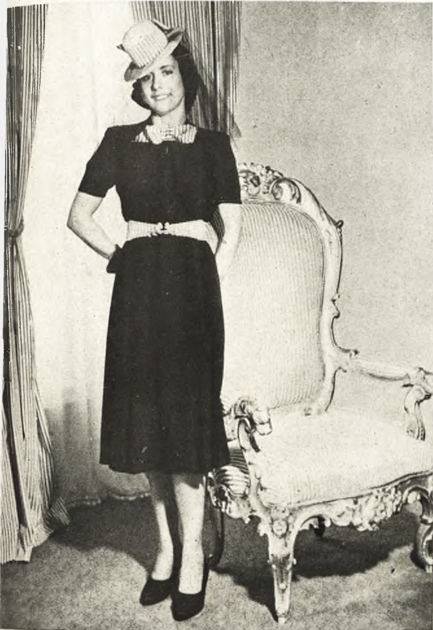
MODELO "COLONIAL" — Crespón de lana marino, falda y cuerpo plisados, con corbata y cinturón de raso rayado, rojo y blanco, y broche de leones dorados. Para completar el tocado, sombrerito de paja blanca, velo negro muy amplio, cinta ancha de raso rayado y guantes rojos.

EN España, la Sección Femenina de Falange Española Tradicionalista y de las J. O. N. S., ha afrontado en toda su amplitud la misión de una Moda nacional. Diferentes departamentos de la S. F. trabajan ya activamente. La sorpresa será magnífica para