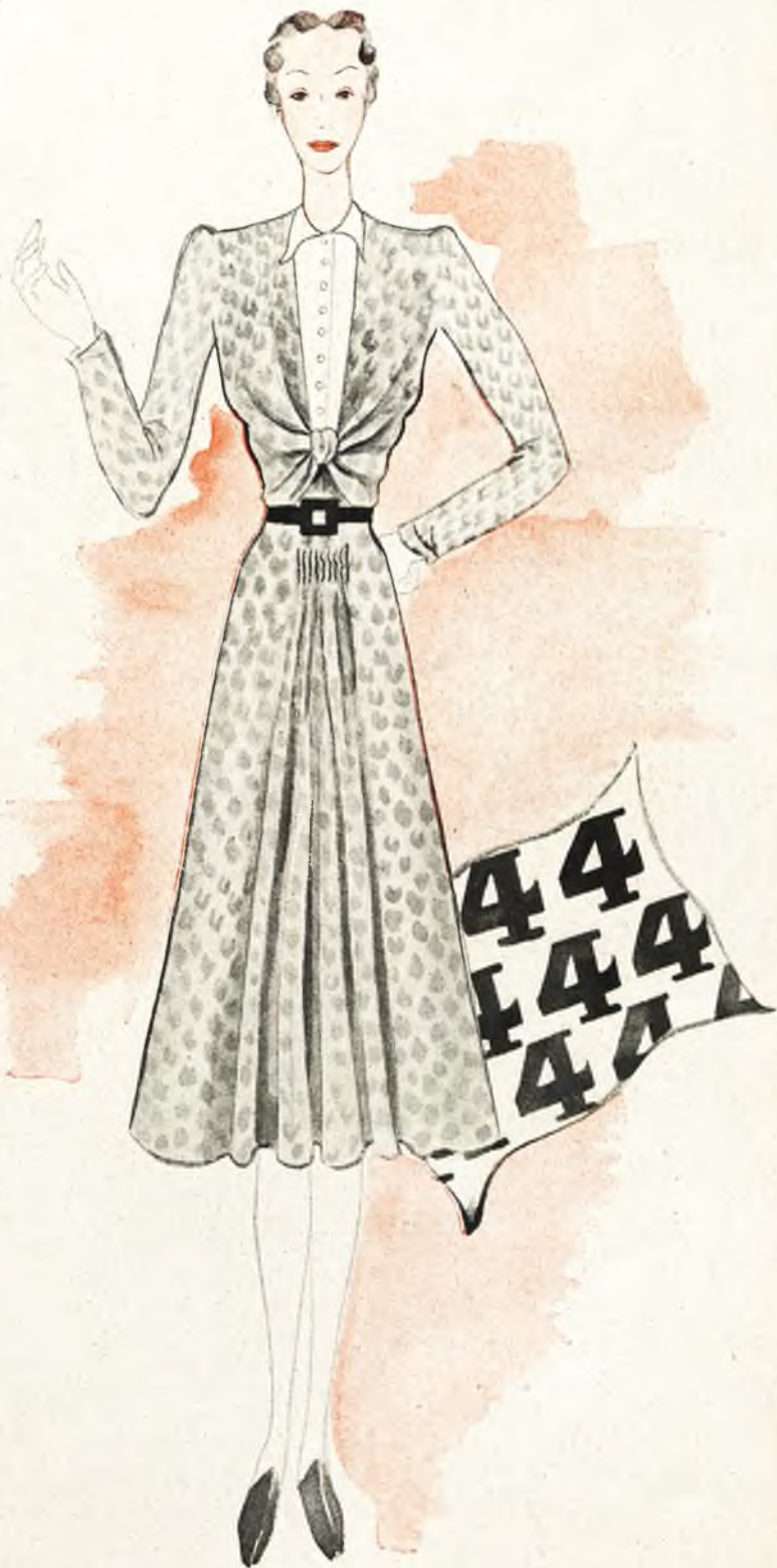
TRAJE DE TARDE.— Estampado de cuatros — 4, 4, 4... — y marrocaín blanco en el cuello y en el pechero. Ciniendo el cuerpo de este traje de tarde, una banda drapeada de cuatros, que se cierra, en la espalda, con una cremallera.

Colaboran en el alto propósito artistas y políticos, fabricantes y modistos y modistas... La clientela viene después entrega-