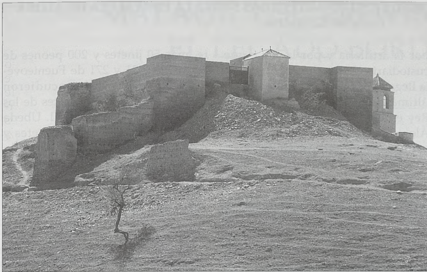
Desde el pueblo, otra perspectiva de la fortaleza

tramo entre el «nudo» de Bobadilla y Álora.