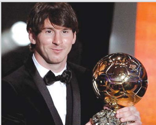
Leo Messi, con el Balón de Oro.

En pocos días, dos expresidentes del Gobierno de España han sido contratados por empresas energéticas que ellos privatizaron. Felipe González, por Gas Natural, y José María Aznar, por Endesa. Hay quien dice que es lógico que las grandes empresas quieran aprovechar los conocimientos de figuras tan importantes; de acuerdo. Pero también hay quien dice que no parece muy ético que sea precisamente en esas empresas que eran de capital público y las pusieron en manos de un capital privado que ahora se muestra muy generoso. Como hay un presidente por cada partido, no se puede hablar de discriminación ni de manías persecutorias. Igual de procedente o improcedente, de ético o de lo contrario. Si es legal, adelante, pero que no den lecciones de altruismo. Aznar cobrará 200.000 euros anuales por asesoramiento externo. ¿Qué va a asesorar? Y lo mismo para González.