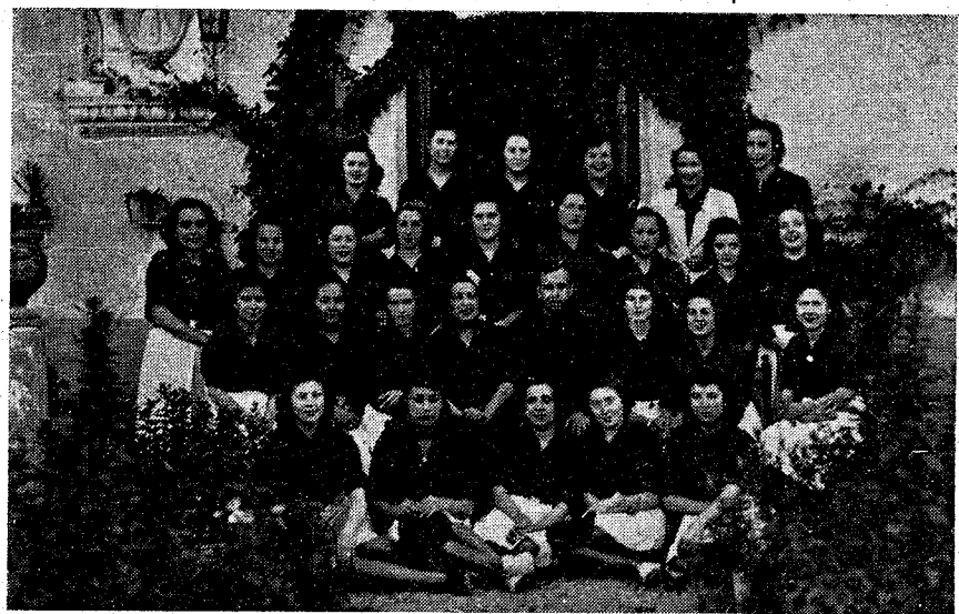
Camaradas de la Sección Femenina de FET y de las JONS de Valdepeñas, que con una actuación digna de todo elogio se han clasificado para la final del II Concurso Nacional de Coros y Canciones que se celebrará en Octubre en Madrid.

SANTA CRUZ DE MUDELA. —Se ha celebrado con todo esplendor, en este pueblo, la fiesta del Corpus verificándose la tradicional procesión que, saliendo de la Iglesia Parroquial, hizo el acostumbrado itinerario por las calles Iglesia, Plaza, Ermita, don Máximo Laguna y Cervantes, realizándose varias estaciones en diversos altares que se encontraban primorosamente engalanados de flores. En el cortejo, al más de numerosos fieles, figuraba Acción Católica y sus Juventu-