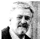
Manuel Marín PRESIDENTE DE LA FUNDACIÓN IBERDROLA

El Consejo Regulador de la D.O. Valdepeñas ha distinguido con la Insignia de Oro a Manuel Marín, presidente de la Fundación Iberdrola y ex presidente del Congreso de los Diputados. Su elección se debe a que se trata de una persona cercana a la tierra y a que posee una dilatada trayectoria profesional y personal de gran calado.