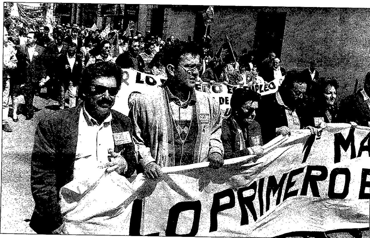
Los sindicatos esperan una respuesta masiva de los trabajadores de Guadalajara.

CUMPLIMIENTO DEL ACUERDO. —El manifiesto que leerán los líderes sindicales durante los