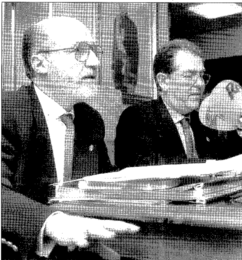
El alcalde y el concejal de Hacienda, durante la presentación de los presupuestos.

Cabe destacar que este año en Ayuntamiento no invertirá en la compra de patrimonio, ya que en 1996 se destinaron 300 millones de pesetas para este fin. Bris ha señalado que el dinero se destinará al arreglo y mejora del patrimonio adquirido con anterioridad. Entre las inversiones previstas para 1997 destacan 190 millones de pesetas para la ampliación de la Casa Consistorial con la compra de los inmuebles colindantes, 100 millones para el Teatro, 120 millones