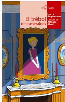
El trébol de esmeraldas