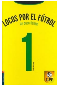
Un buen fichaje