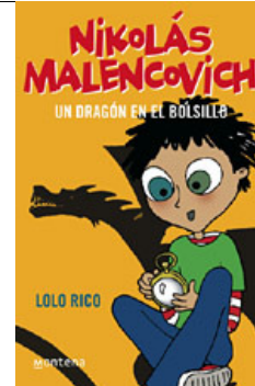
Un dragón en el bolsillo