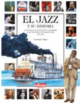
El jazz y su historia