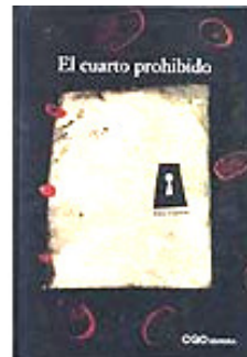
El cuarto prohibido