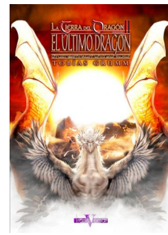
El último dragón