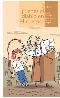
¡Tienes el diablo en el