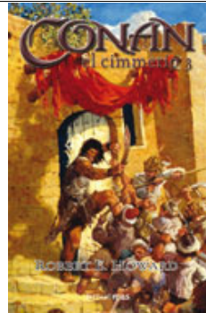
Conan, el cimero