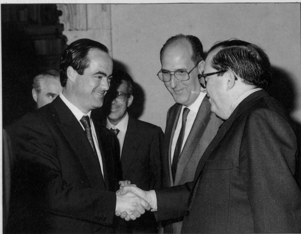
El Presidente de Castilla-La Mancha, José Bono, saluda a los responsables del Proyecto del nuevo Grupo Térmico.

La nueva Central Termoeléctrica de Puertollano constituye "uno de los proyectos más importantes que ha habido en la historia de la región", según el Presidente de Castilla-La Mancha, José Bono. Esta central se considera "única en el mundo" por su alta tecnología, su elevado rendimiento y la máxima protección al Medio Ambiente.