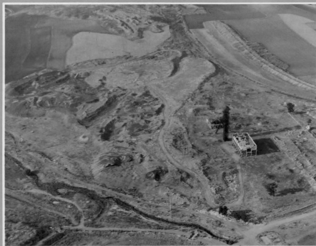
Vista aérea de la zona minera del Pozo Norte con el castillete, espacio actualmente convertido en escombreras y la solución que aporta una de las empresas ganadoras para rehabilitar este área con un bosque y jardines con instalaciones de recreo