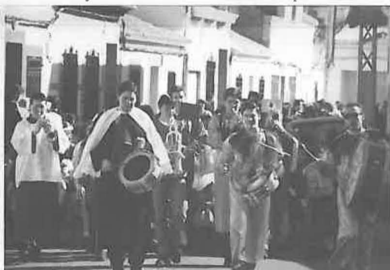
Las charangas han animado nuestro pueblo, tanto durante los distintos actos como en el carnaval callejero.