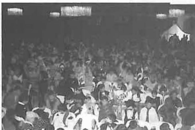
Cada año se incrementa la participación de los más pequeños: alrededor de 1.000 niños y niñas se dieron cita en la fiesta infantil.