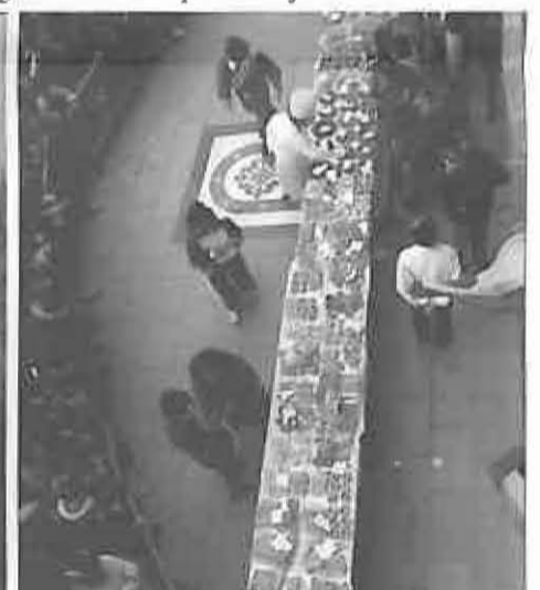
Más de 100 personas participaron en el tradicional concurso de fruta en sartén: cerca de dos horas de concurso y apenas cinco minutos para consumir más de 1.000 piezas presentadas.