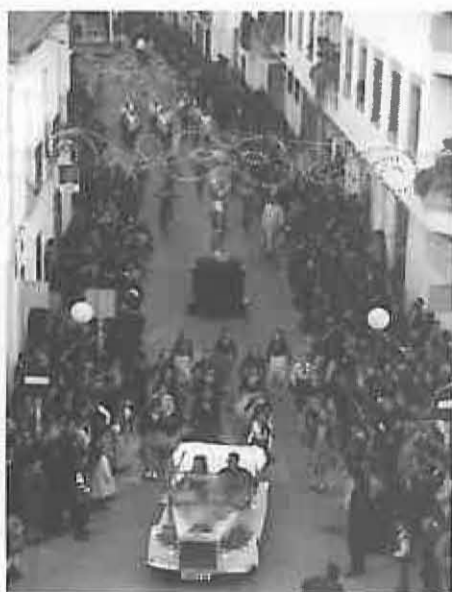
La Peña «Los Amigos del Arte» al igual que el año anterior, se llevaron las 300.000 ptas. del premio especial por su montaje sobre el 7º Arte.