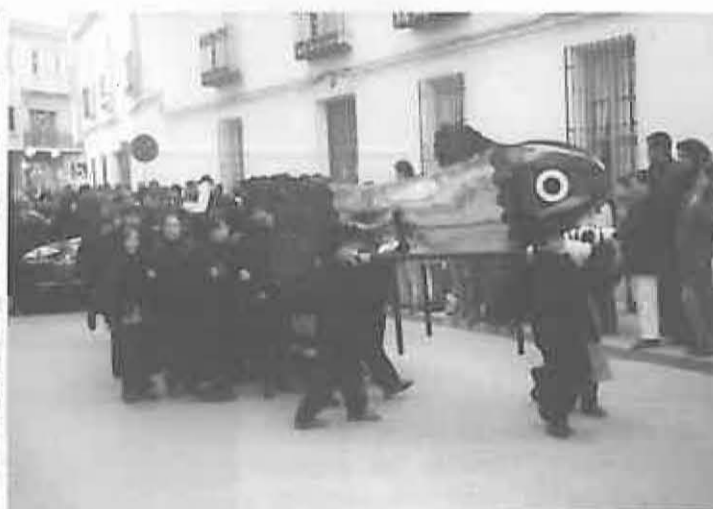
En el Entierro de la Sardina hasta los más pequeños tuvieron su propia finada.

Cuarto Premio: 60.000 ptas. - El Bufón de Miguelturra