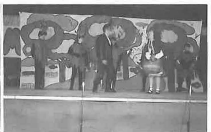
El grupo de teatro Flauti Flauti, perteneciente a la Universidad Popular, puso en escena una singular versión de Caperucita Roja en el día de los niños.