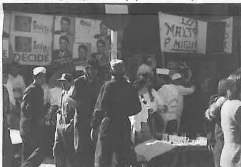
Las peñas ofrecieron durante los tres primeros días de fiestas sus mejores platos a cuantos miguelturreños y visitantes se acercaron por sus improvisados tenderetes.