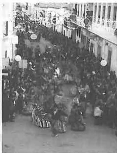
Treinta y tres peñas participaron en el desfile del domingo de Piñata, que fue presenciado por unas 15.000 personas.