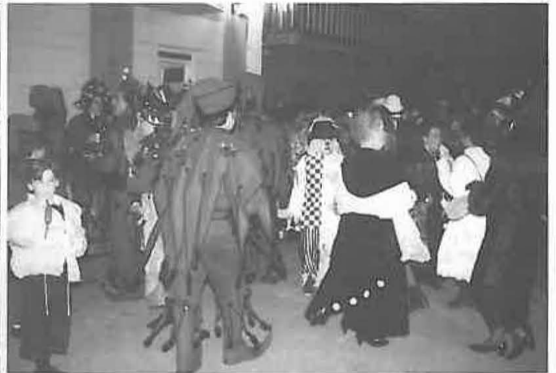
Las peñas y las máscaras se reúnen para recoger a las Máscaras Mayores en el día de su proclamación.