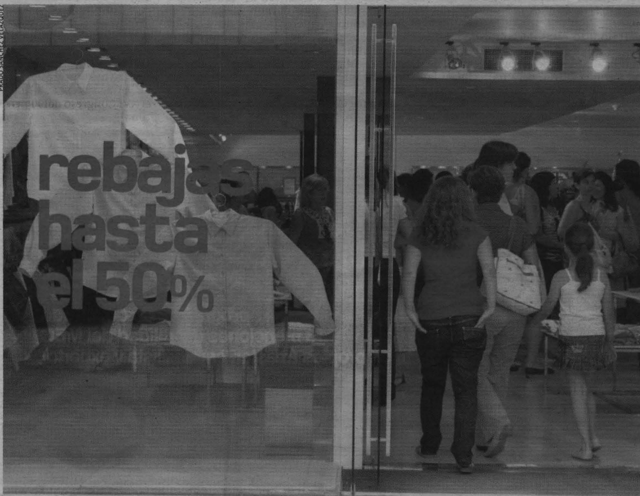
No existe normativa que permita a los comerciantes rechazar las devoluciones de productos comprados en rebajas.

EL FESTIVAL de Matarile tiene previsto celebrarse entre el jueves y el sábado próximos en el recinto Paletter de Paiporta. METRO