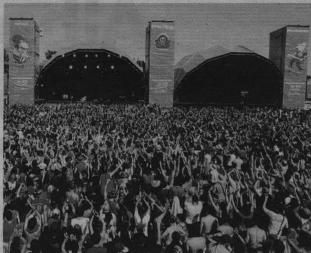
El nombre de Viña Rock surgió en 1996, cuando un grupo de jóvenes se reunió con el concejal de Cultura de Villarrobledo para organizar en la localidad un festival de música arte-nativa .

Por todo ello, la UCE recomienda que se planifiquen las compras adquiriendo "sólo aquello que necesitamos". De lo contrario podemos entrar en "una dinámica de compra compulsiva" y realizar gastos innecesarios. METRO