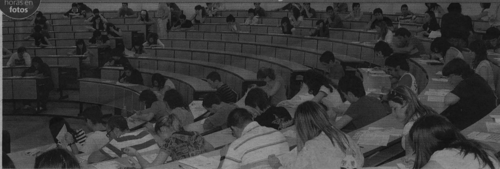
PRIMER DÍA. Más de 6.000 alumnos comenzaron a examinarse de las pruebas de Selectividad en el distrito universitario de Castilla-La Mancha. Los matriculados en la provincia de Ciudad Real (en la imagen) fueron 1.917 y en la de Toledo, 1.980.

Selectividad Miles de alumnos castellano-manchegos inician los exámenes