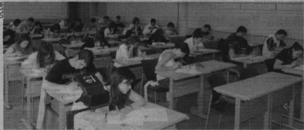
CUENCA. Un total de 667 alumnos se matricularon en Cuenca.