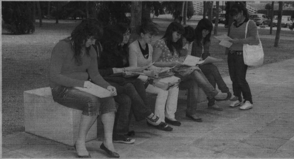
ESTUDIANDO. Los candidatos a universitarios rodean los centros educativos cargados de libros y apuntes. Apuran hasta el último minuto para llegar preparados al examen.

ALBACETE. Todos los alumnos podrán conocer sus resultados a partir del 21 de junio en Internet, a través de la página web de la Universidad ( www.uclm.es ) o enviando un SMS al número 404. En el campus de Albacete se matricularon 1.613 alumnos.