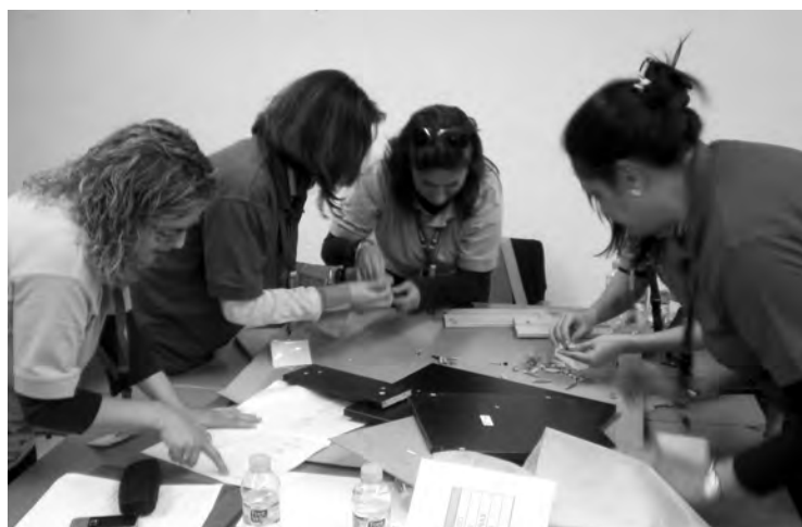
Los trabajos en grupo centraron la mayor parte de las actividades de las dos jornadas de trabajo.

Desde CEOE-CEPYME Guadalajara, junto con la Universidad de Alcalá de Henares, ya se está organizando la tercera edición de este curso de Experto en Gestión Empresarial y en breve se darán a conocer las fechas de matrícula y los requisitos necesarios para poder realizar este curso con título propio de la Universidad alcalaína.