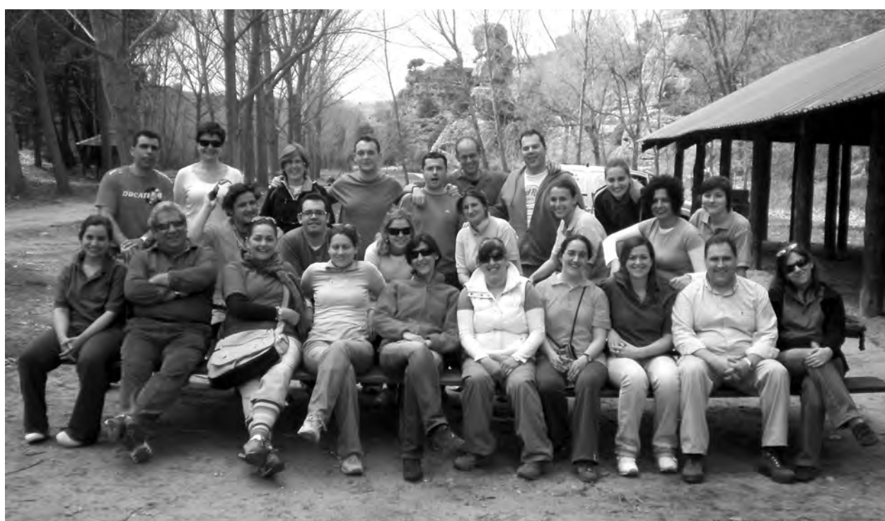
Foto de grupo de los alumnos y profesores que asistieron a la convivencia del Curso de Experto en Gestión Empresarial.

En breve se darán a conocer los plazos para la inscripción de la tercera edición del curso que, en sus dos primeras ediciones, ha resultado un gran éxito de participación, además tiene la categoría de título propio de la Universidad de Alcalá de Henares