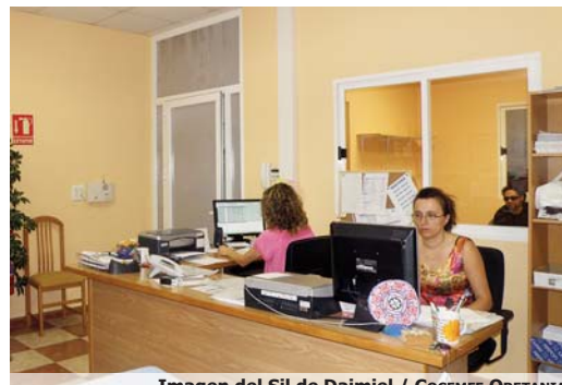
Imagen del SIL de Daimiel / COCEMFE ORETANIA

La búsqueda de un empleo, tanto por cuenta ajena, como por cuenta propia requiere para cualquier persona la puesta en marcha de una estrategia de planificación y ejecución de actividades que resulten adecuadas para lograr su fin, conseguir un puesto de traba-