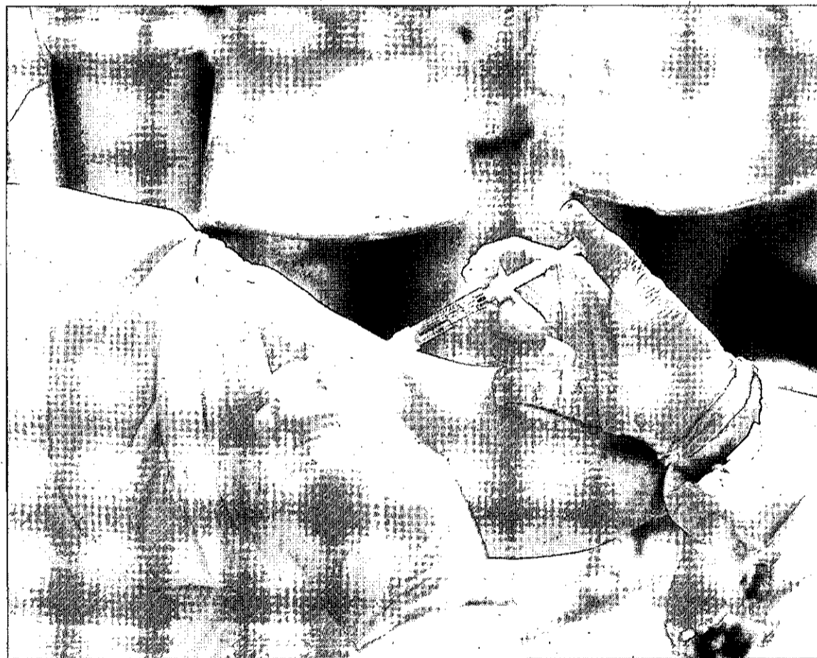
Un paciente se inmuniza frente a la gripe estacional en el marco de la última campaña de vacunación.