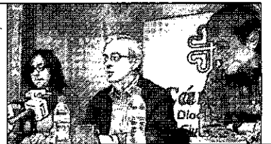
Imagen de la presentación de la campaña.

es el porcentaje de vehículos nuevos adquiridos a cuenta del Plan 2000E en la provincia. Sólo un 11,7% fueron coches de ocasión, un mercado muy afectado.