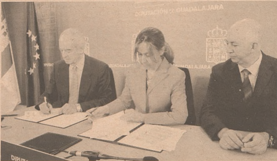
La firma tuvo lugar en la Diputación Provincial de Guadalajara. / Marta Sanz