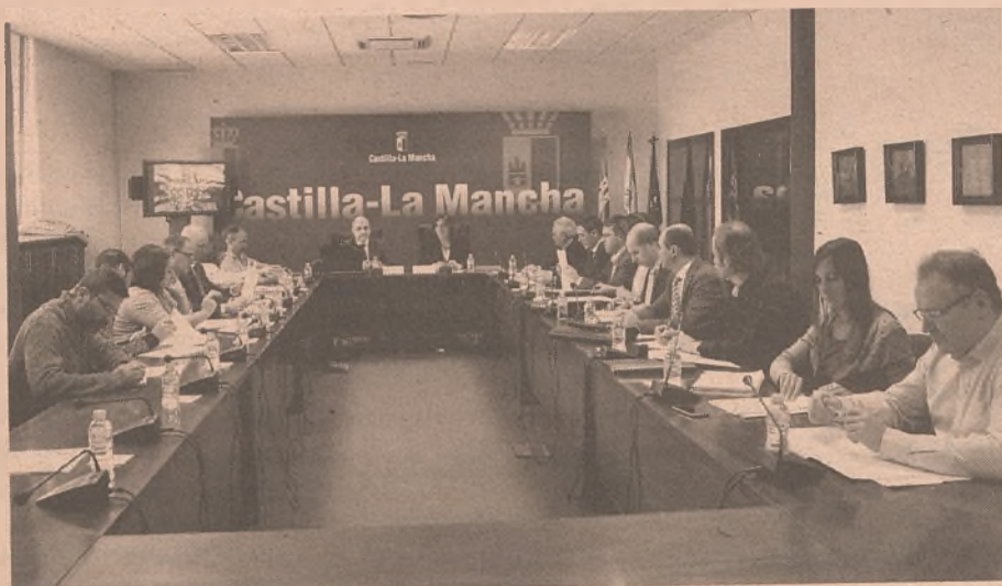
Las fuerzas sociales y políticas trabajan juntas por la recuperación en la región. / Economía de Guadalajara