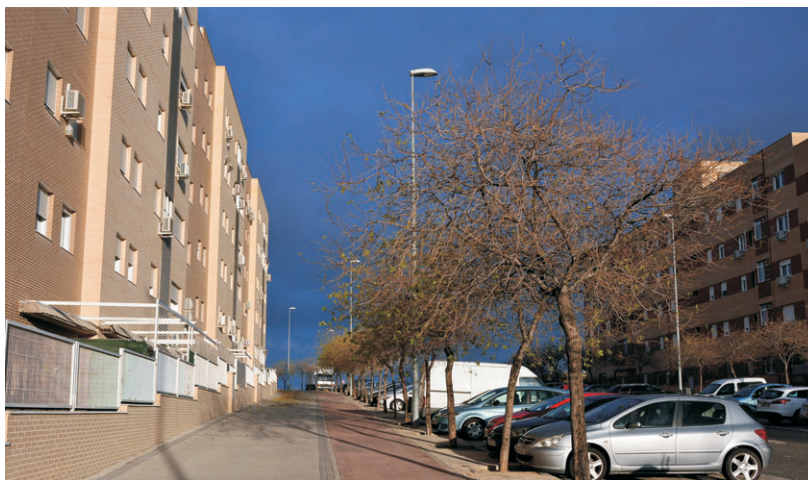
El arbolado Laguna de Arcas es un foco de problemas.

El Ayuntamiento fumiga dos veces al año, lo que permite eliminar el pulgón, pero de manera temporal, no definitiva. Los vecinos se quejan de que no les