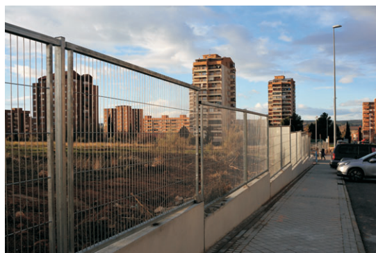
Cerramiento en Cascajoso.