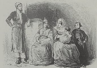
Lámina publicada en La Ilustración Artística que reproduce una pintura de Samuel Hirszenberg que lleva por título "El estudio del Talmud" y pintada en 1887.