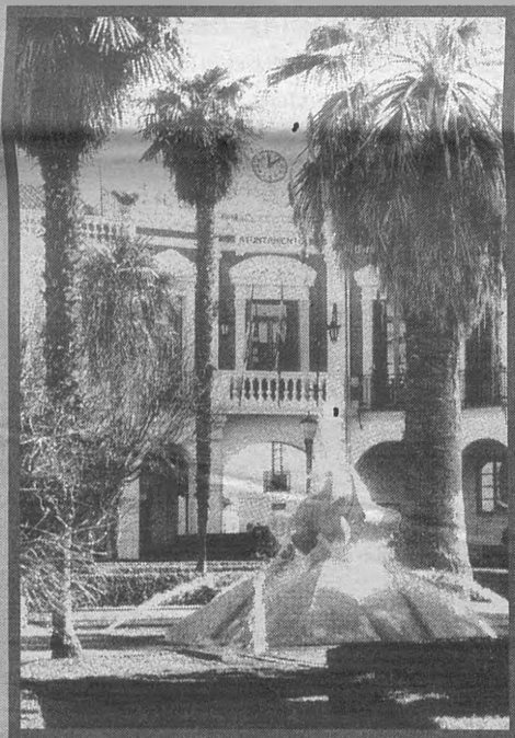
MANZANARES. Del 17 al 21 de julio, Manzanares celebra su tradicional Feria Regional del Campo y de Muestras, celebración que coincide con la Feria y Fiestas tradicionales de una población que es un auténtico "cruce de caminos" por su privilegiada situación estratégica.