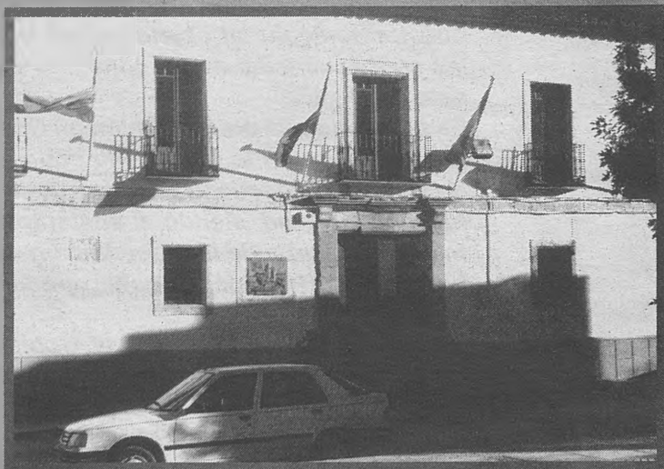
LAS PEDROÑERAS. La "capital del Ajo" muestra su principal producto al mundo del 26 al 29 de julio. Este año, en su XXXVI edición, volverá a impresionar a sus visitantes con el especial mimo que pone en sus trabajos, así como la hospitalidad de sus habitantes. En los primeros días del mes de septiembre, la localidad celebra su Feria y Fiestas.