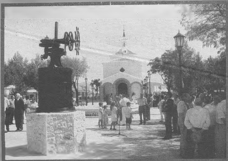
SOCUÉLLAMOS. En honor al Santísimo Cristo de la Vega, esta localidad manchega viste sus mejores galas festivas del 9 al 15 de agosto. Sus caldos, su gastronomía, su casco antiguo, y sobre todo, unos ciudadanos hospitalarios, hacen que este rincón manchego sea de obligatoria visita.