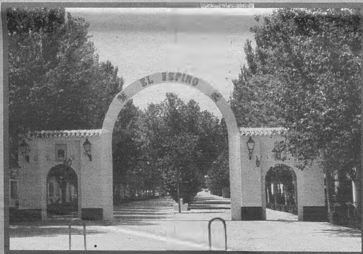
MEMBRILLA. Sus tradicionales fiestas de los Desposorios, en honor a la Virgen del Espino, se celebran el penúltimo fin de semana de agosto, con la procesión y la representación de "Los Desposorios de la Virgen María con San José", que pasa por ser la única de estas características en España.