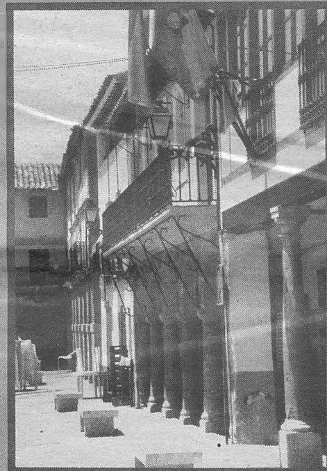
LA SOLANA. Cuna de la zarzuela y del esparto, es la población manchega donde el sol adquiere su máximo resplandor. Celebra sus fiestas en honor a Santiago y Santa Ana del 24 al 28 de julio, propiciando una espléndida oportunidad para visitar los tradicionales rincones de un enraizado pueblo manchego.