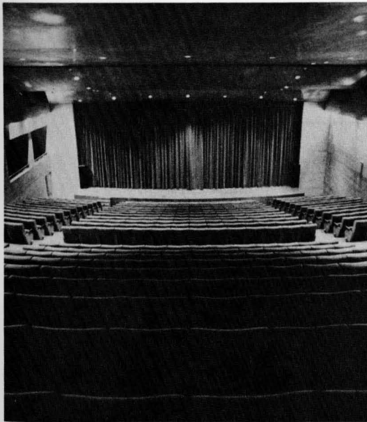
Auditorio del Ayuntamiento de la ciudad, escenario de conciertos y representaciones teatrales.