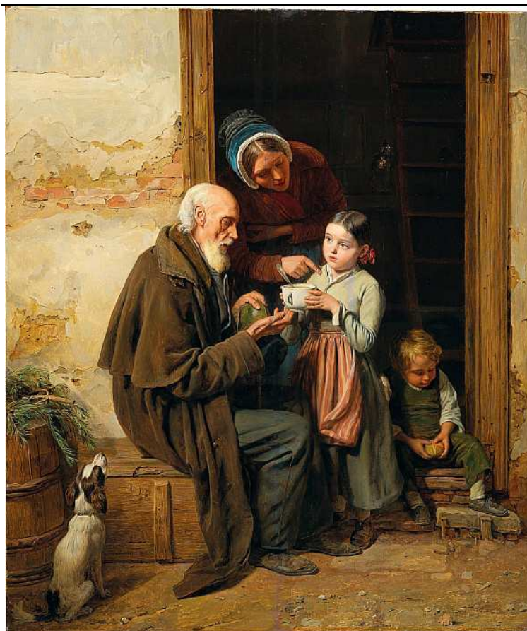
FERDINAND GEORG WALDMÜLLER: El regalo suave. 1850