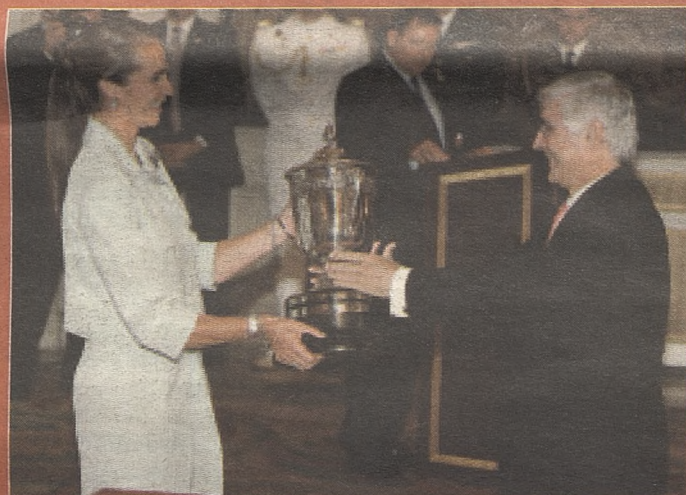
El presidente de Castilla-La Mancha, José María Barreda, posa junto al resto de galardonados con los miembros de la Familia Real, tras la entrega de los Premios Nacionales del Deporte, en el Palacio Real de Madrid (arriba). A la izquierda, el presidente de Castilla-La Mancha recibe el premio 'Infanta de España Doña Elena' con el que el Consejo Superior de Deportes distingue a la campaña-programa de la Comunidad Autónoma 'Juego Limpio en el Deporte y la Educación Física'.

haciendo en Castilla-La Mancha", puntualizó el presidente.