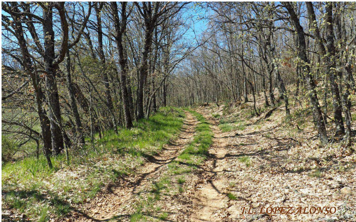
LA ÚLTIMA PARTE DEL RECORRIDO DISCURRE ENTRE EL REBOLLAR