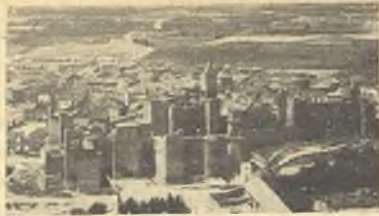
Castillo de Olite.

Real de Olite, en El Pensamiento Navarro , Pamplona, 23 de julio de 1952.