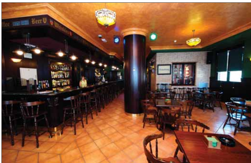
Con el más genuino estilo de taberna irlandesa, la oferta de Casa Quintana se complementa con un lujoso pub.

No obstante, en su opinión, el proyecto más interesante en el que está volcando Casa Quintana todos sus esfuerzos es en el fomento del turismo local, para lo cual se organizarán excursiones concertadas con visitas a todos los lugares de interés turístico, siendo de especial interés las cuevas de champiñones. Además se están estableciendo