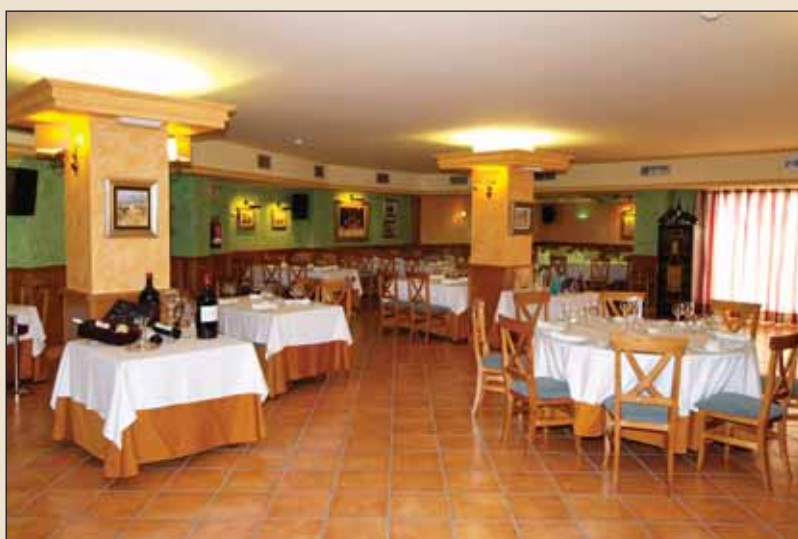
La cocina del restaurante del hotel es una de las grandes bazas de Casa Quintana.

A pesar de la rápida aceptación del complejo, se está llevando a cabo una gran campaña de difusión a través de la página web y de las guías turísticas de Cuenca ( www.hotelradecuenca.com y www.turismoruraldecuenca.com ), así como a través de cuñas de radio en emisoras de la comarca.