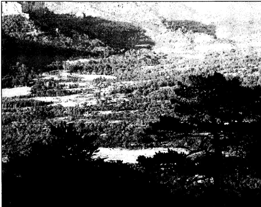
Hotel Cañete está situado en la alta montaña, en la Serranía de Cuenca.

Comenzó con once habitaciones y en la actualidad dispone de sesenta y tres, de las que cuatro son suits