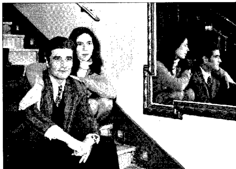
PRESENTACIÓN La compañía, ayer en el Lara, donde estrenarán su montaje el próximo día 16.

ciudades de Andalucía y el Norte de España. Por eso, después de terminar en Madrid, la compañía seguirá con su función por el resto de España. Miguel Narros, que no pudo asistir ayer a la presentación del acto, siempre recuerda que Yerma carece de argumento, es un carácter desarrollado a lo largo de la obra. Hay un tema, no un argumento. El tema es clásico pero quiere que tenga un desarrollo y una intención totalmente nueva. Una tragedia con cuatro personajes principales y coros, como han de ser las tragedias".