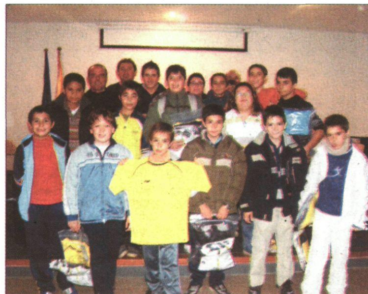
Los jóvenes de Arenas de San Juan posan con sus nuevas camisetas. / LT