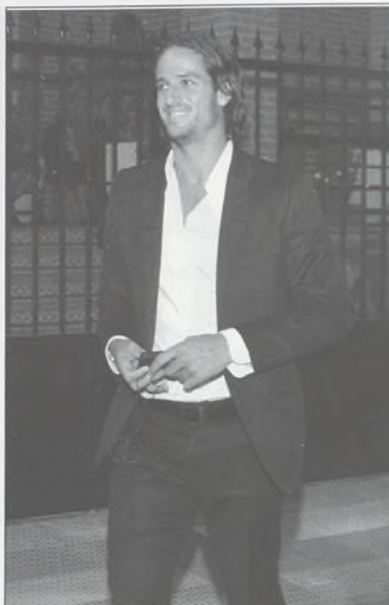
Feliciano López dió el pregón de Portillo antes de marcharse a Japón para disputar un torneo.