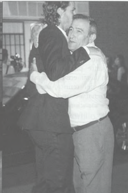
El tenista recibió numerosas muestras de afecto de la gente. Sus padres son de Portillo y sus abuelos viven en la localidad.