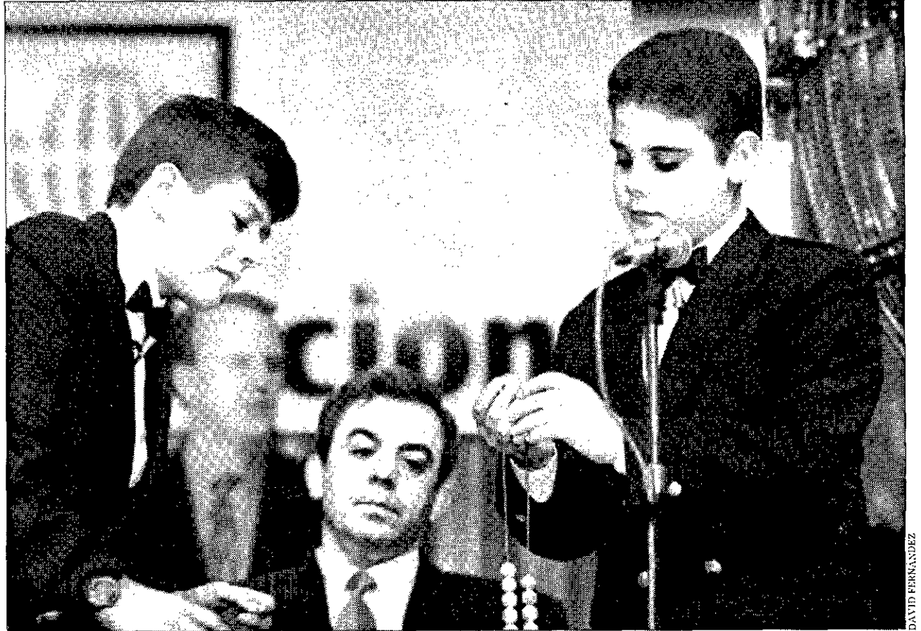
LOS NIÑOS DE LOS MILLONES Los estudiantes del Colegio San Ildefonso serán los protagonistas de la mañana en la televisión.

La cadena privada ha puesto también en alerta a sus delegaciones para cubrir toda la geografía nacional, que contarán con varias unidades móviles y dos helicópteros que les facilitarán el trabajo.