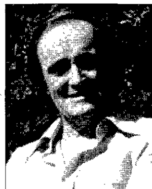
RECUERDO Rodríguez de la Fuente.